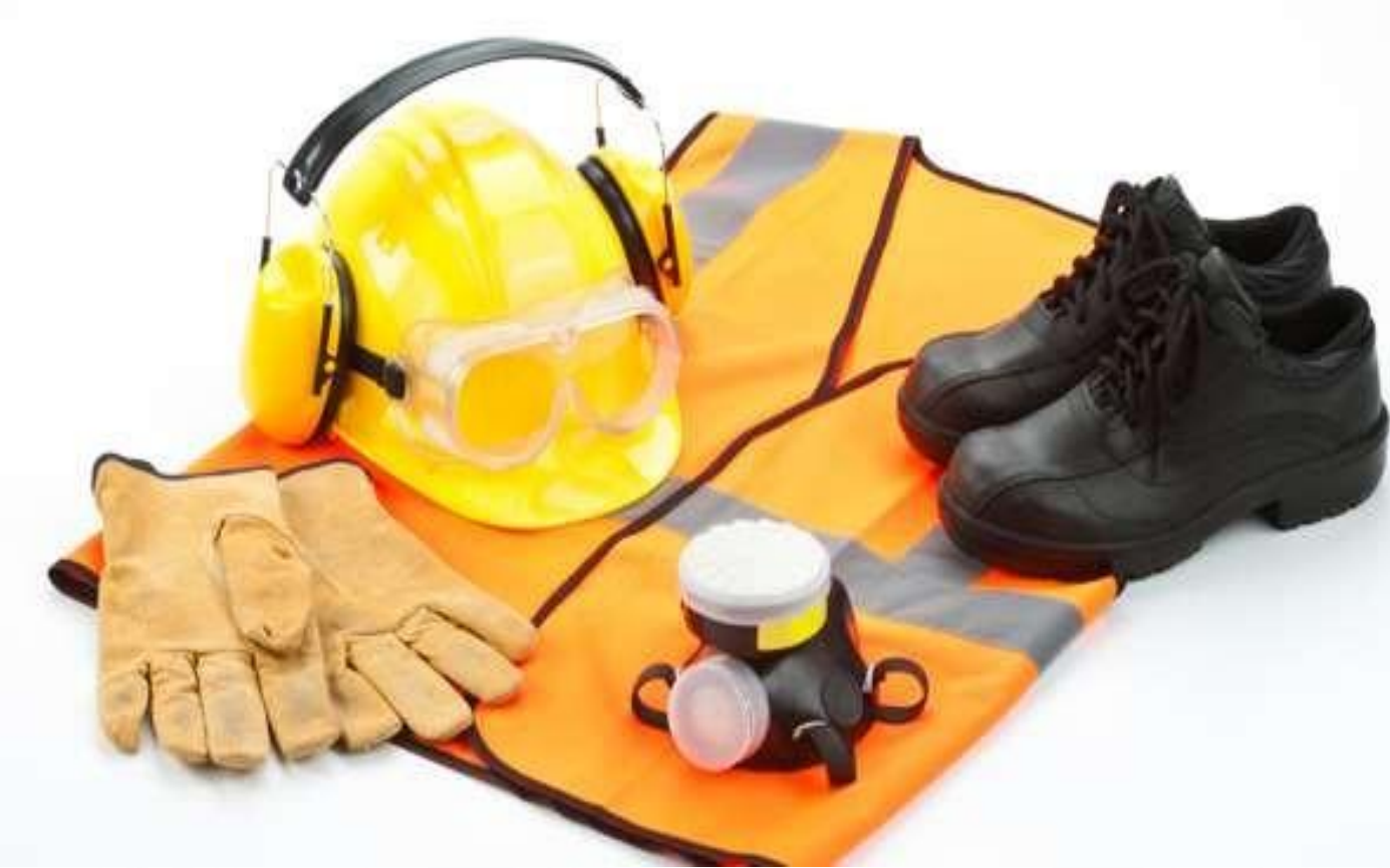
Kişisel Koruyucu Donanımlar (KKD)